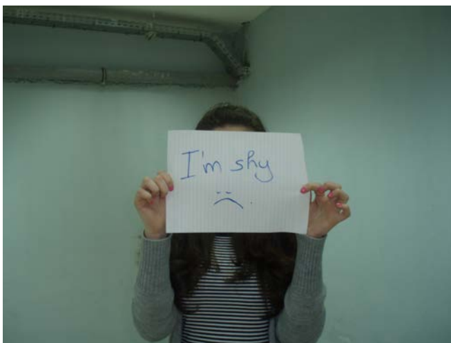
Εικόνα 3. Φωτογραφικό πορτρέτο μαθήτριας.

Οι επόμενες δυο συναντήσεις αφιερώθηκαν στην ετοιμασία των εργασιών των ομάδων και στην προετοιμασία της παρουσίασης για την εκδήλωση παρουσίασης των Ερευνητικών Εργασιών του σχολείου. Η συνεργασία της μουσειοπαιδαγωγού και σε αυτό το τελικό στάδιο ήταν ιδιαίτερα βοηθητική για τους μαθητές.