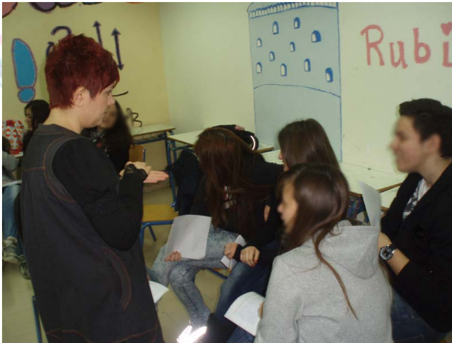
Εικόνα 1. Η μουσειοπαιδαγωγός του Μουσείου Φωτογραφίας Θεσσαλονίκης στο σχολείο.