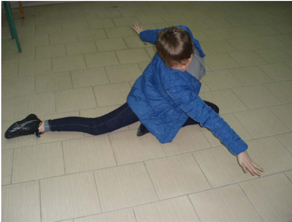
Εικόνα 2. Φωτογραφικό πορτρέτο μαθήτριας.

Οι επόμενες δυο συναντήσεις αφιερώθηκαν στην ετοιμασία των εργασιών των ομάδων και στην προετοιμασία της παρουσίασης για την εκδήλωση παρουσίασης των Ερευνητικών Εργασιών του σχολείου. Η συνεργασία της μουσειοπαιδαγωγού και σε αυτό το τελικό στάδιο ήταν ιδιαίτερα βοηθητική για τους μαθητές.